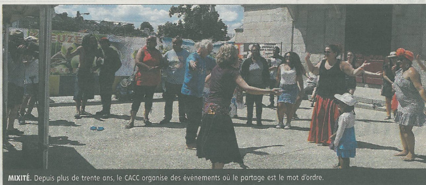
MIXITÉ. Depuis plus de trente ans, le CACC organise des événements où le partage est le mot d'ordre.